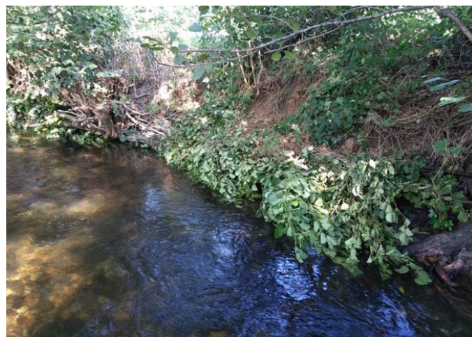
Berges après travaux fascines, réalisés par les bénévoles de l'AAPPMA de la Basse Desges

Chanteuges : Chantier de protection de berges et de création d'habitats piscicoles sur la Desges à l'aide du génie végétal.